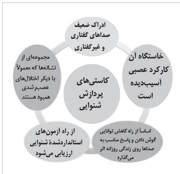
شکل ۲) تعریف کاستی‌های پردازش شنوایی (BSA, ۲۰۰۱) (۵).

این اصطلاح که به‌طور مناسبی جایگزین اصطلاح کاستی پردازش شنوایی مرکزی شده است بدون این که لزوماً مشکلات را به یک مکان کالبدشناختی نسبت دهد بر تعامل اختلال در هر دو دستگاه مرکزی و محیطی تأکید می‌کند. کاستی‌های پردازش شنوایی که در کودکان با شنوایی بهنجار موجب کاهش گستره توجه، و مهارت‌های گوش دادن ضعیف می‌شود و با کم‌شنوایی محیطی نیز همبود است (۹) دارای تعریف دقیقی نیست بلکه مجموعه‌ای از آسیب‌های کارکردی متفاوت را دربردارد (۸). به عبارت دیگر، تعریف جامع و پذیرفته‌شده‌ای از کاستی‌های پردازش شنوایی وجود ندارد و کاستی پردازش شنوایی به شیوه‌های مختلفی تعریف شده است. از جمله برحسب ویژگی‌ها، خاستگاه، اثر بر زندگی روزانه، روش‌های ارزیابی، و نشانه‌ها ۱ (شکل ۲)، یا بر اساس دسته‌بندی بین‌المللی کارکرد، کم‌توانی، و بهداشت (ICF) ۲ سازمان بهداشت جهانی ۳ (شکل ۳) (۵).