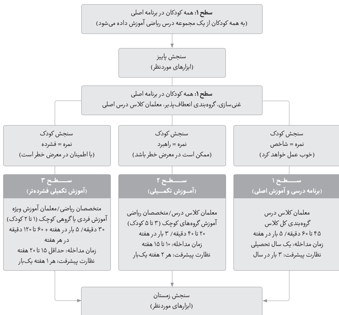
نمودار ۴) نمونه‌ای از مدل چندسطحی پاسخ به مداخله در یک دبستان، اقتباس از کووالسکی و همکاران (۳۵)

سطح امکان دارد به‌عنوان مکمل یا جایگزین برای آموزش‌های سطح ۱ و سطح ۲ به‌کار گرفته شوند (۳۳). در واقع، این سطح برای کودکانی است که کمترین پاسخ را به پیشگیری ثانویه (سطح ۲) نشان می‌دهند و به پشتیبانی گسترده‌تر و اغلب فردی با مهارت‌های هدفمند که نیازهای تحصیلی منحصر به فرد آنها را برآورده می‌کند، نیاز دارند. در این سطح، ارزیابی جامع توسط یک کارگروه متشکل از افراد با تخصص‌های مختلف برای تعیین میزان مناسب بودن آموزش خاص و خدمات مرتبط انجام می‌شود. بر خلاف برخی تصویرسازی‌ها، مفهوم‌سازی یک مدل سه سطحی، سطح ۳ را با آموزش ویژه برابر نمی‌کند. در مقابل،