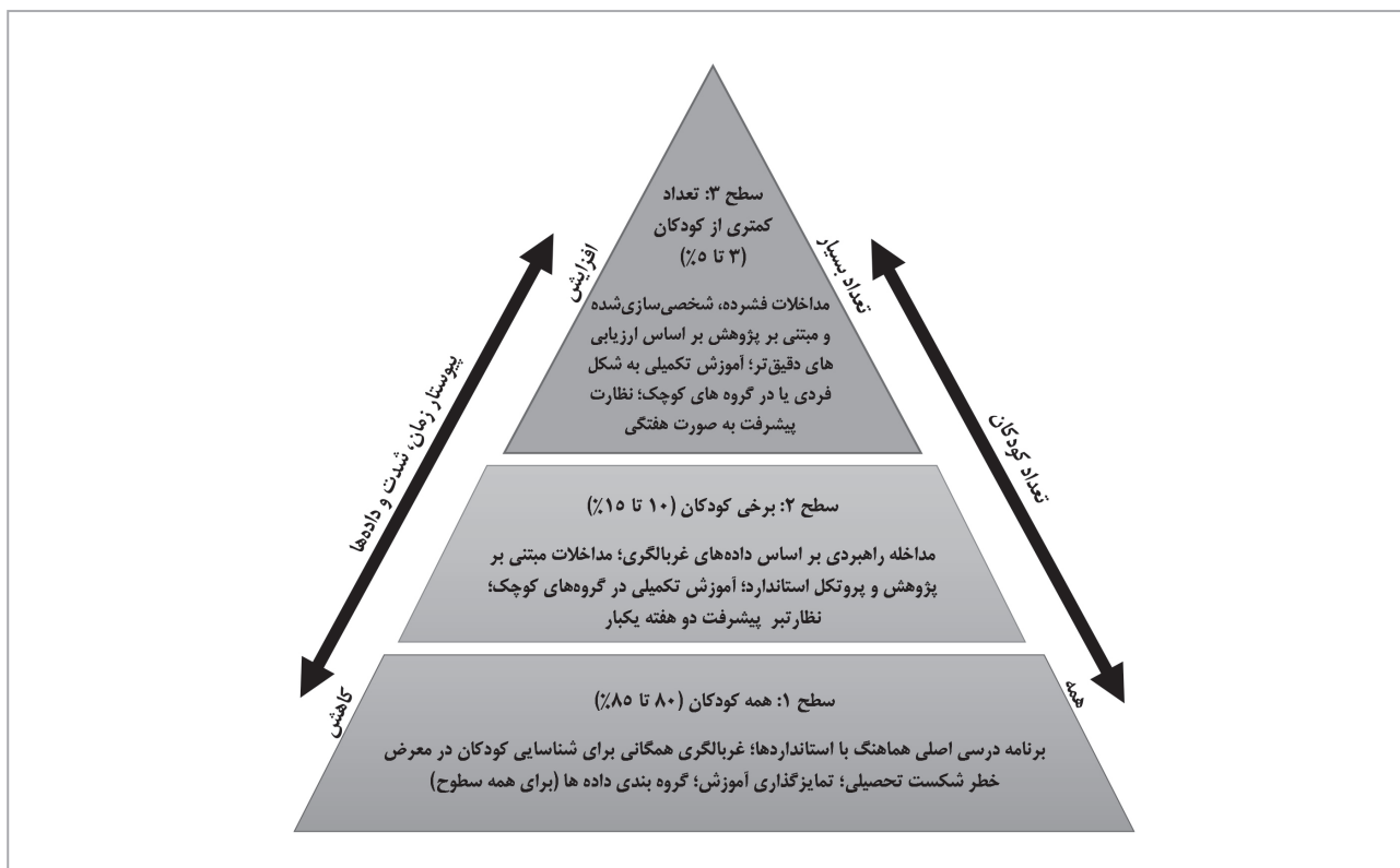
نمودار ۳) مدل سه سطحی آموزش و پشتیبانی پاسخ به مداخله، اقتباس از کووالسکی و همکاران (۳۵)

رویکرد پاسخ به مداخله، تشخیص به‌هنگام توسط معلمان، با استفاده از روش‌های غربالگری برای شناسایی کودکان در معرض خطر مشکلات یادگیری ریاضی را پیش‌بینی می‌کند. سپس، در صورت تداوم مشکلات، کودکان در معرض خطر در محیط مدرسه به مجموعه‌ای از مداخلات با شدت بیشتر ارجاع داده می‌شوند (۷). در هر دو قانون هیچ کودکی نباید عقب بماند ۱ و قانون آموزش افراد با ناتوانی ۲ بر اصول کلیدی این الگو تأکید شده است و جایگزین مؤثر مدل اختلاف توانایی-پیشرفت محسوب می‌شود (۶). در حالی که الگوی پاسخ به مداخله شامل فرآیندی است که برای تعیین نیازهای آموزشی کودکان استفاده می‌شود، اما با روند ارجاع آموزش ویژه مترادف نیست. در واقع، برترین مزیت الگوی پاسخ به مداخله، محدود کردن شناسایی و مداخله به منابع موجود در مدارس بدون ارجاع به متخصصان است. این امر مطابق با شواهد فزاینده ماهیت ناهمگون مشکلات یادگیری ریاضی است و به‌طور هم‌زمان، از تأثیرات برجسب زدن نامطلوب نیز جلوگیری می‌کند (۷). الگوی پاسخ به مداخله شامل ۴ مؤلفه اساسی، از جمله تصمیم‌گیری