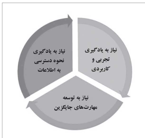
شکل ۲) تغییرات مورد نیاز برای گذر از مراحل انتقال و توسعه شغلی

کلید تعریف ارائه شده برای انتقال در تغییرات زندگی و تعدیل‌های مورد نیاز برای افراد با آسیب بینایی است. تجربه تغییرات در زندگی شخصی و تعدیل‌های مورد نیاز براساس نوع ناتوانی از فردی به فرد دیگر متفاوت است. با این حال، توسعه شغلی که جایگاه ویژه‌ای دارد، نقشی محوری در جهت‌دهی به افراد با آسیب بینایی برای گذر از مراحل انتقال ایفا می‌کند (۳). برای اینکه چنین امری به نحو مؤثری اتفاق بیفتد همان‌طور که در شکل (۲) نشان داده شده است باید ۳ حوزه‌ی مهم در نظر گرفته شود. این ۳ حوزه شامل نیاز به تسهیل یادگیری تجربی و کاربردی، توسعه مهارت‌های جایگزین و یادگیری نحوه دسترسی به اطلاعات در فراگیران است. معلمان یادگیرندگان با آسیب بینایی می‌توانند این موارد را هم در زمینه‌های آموزشی و هم در طول توسعه شغلی ترویج دهند (۱).