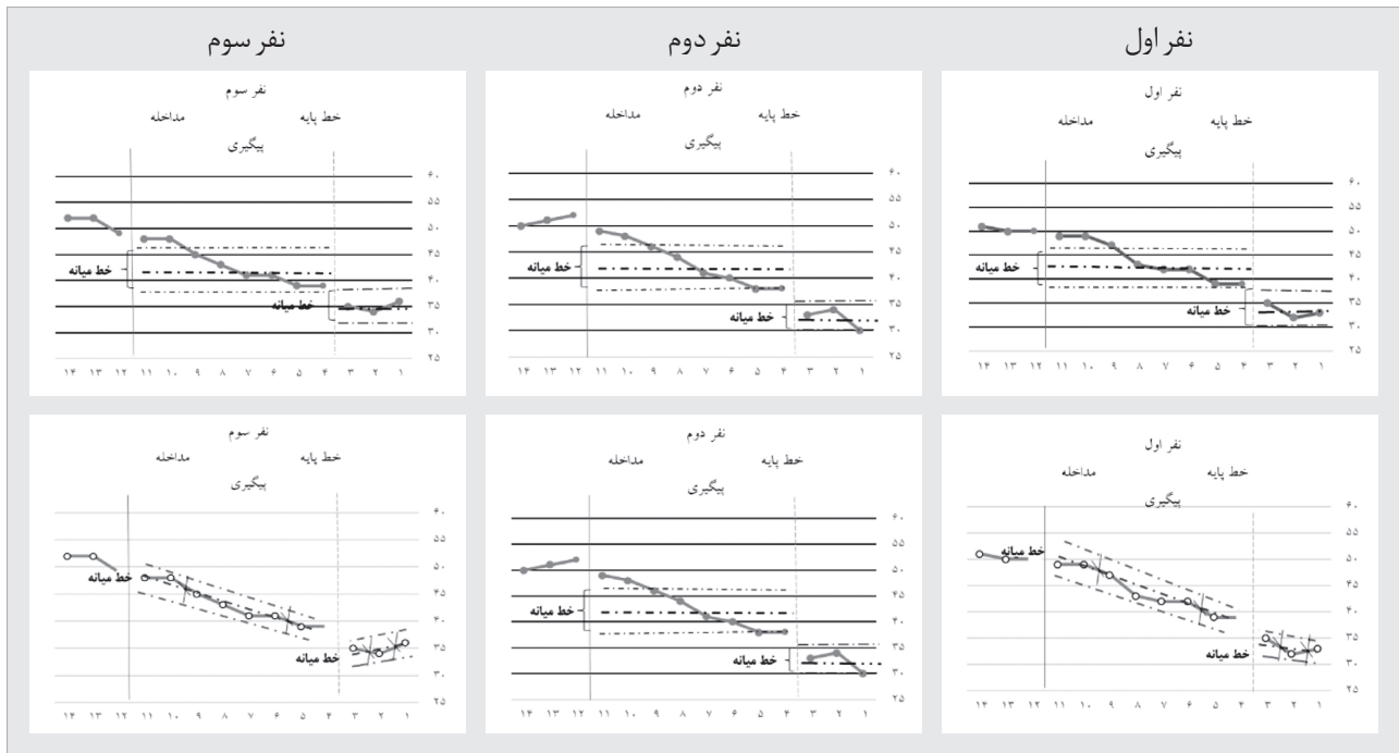
جدول ۷) بررسی شاخص‌های POD، PND، درصد بهبودی و اندازه اثر کلی تأثیر بازی درمانی مبتنی بر رابطه والد-کودک بر مهارت‌های اجتماعی