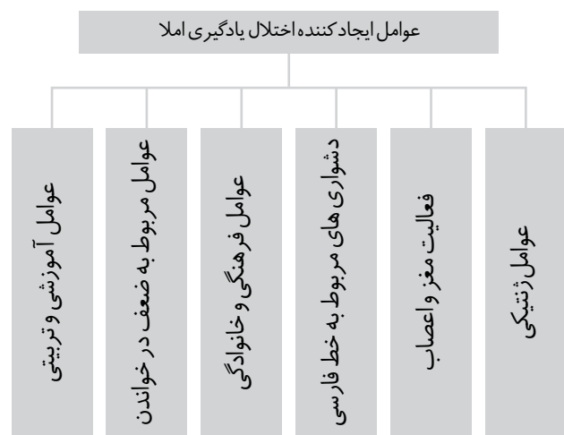
نمودار ۱- عوامل ایجادکننده اختلال یادگیری املا

به‌منظور تسهیل فهم موضوع عوامل موثر در اختلال و مشکل‌های املا به تفکیک بررسی می‌شوند. هم‌چنین، باید به این نکته توجه داشت که هیچ‌گاه يك عامل به تنهایی نمی‌تواند سبب اصلی اختلال در یادگیری املا شود بلکه تمام عوامل در تعامل نزدیک با هم هستند. در ادامه مهم‌ترین عوامل ایجاد اختلال یادگیری املا، همان‌گونه که در نمودار شماره ۱ قابل مشاهده هستند، مرور می‌شوند: